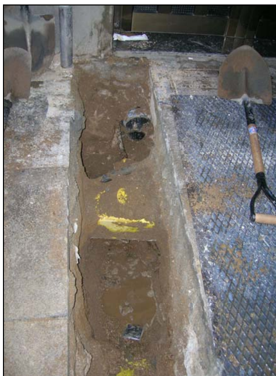
Foto 4: Tubulars finca Esparteria 4 per on s'introduirà la nova línia elèctrica.