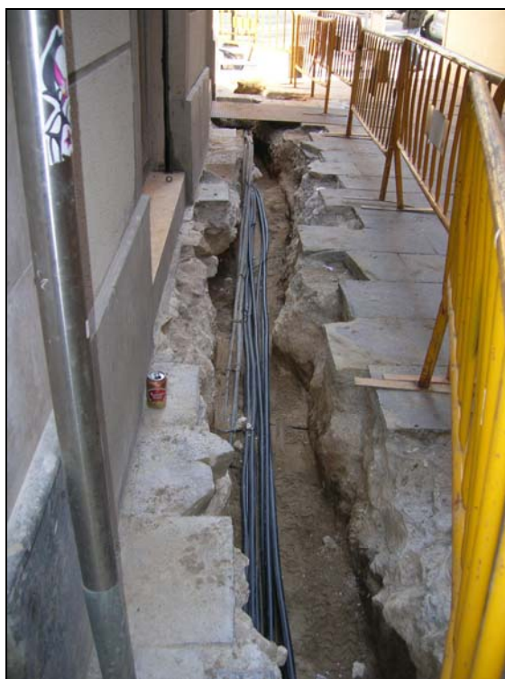
Foto 6: Col·locació cablejat nova línia elèctrica de baixa tensió